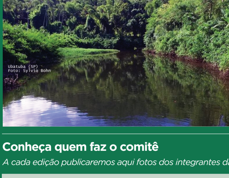
Ubatuba, (SP)

O Comitê de Bacias Hidrográficas do Litoral Norte - CBH-LN segue como sempre, com muitas atividades sendo executadas neste segundo semestre de 2019. As Câmaras Técnicas se dedicaram, além dos assuntos específicos de cada grupo, também na atualização do Plano de Ação do Plano de Bacias Hidrográficas do Litoral Norte, visando definir as ações para o quadriênio 2020-2023. Nesse processo além da revisão, priorização e repactuação das ações para os próximos quatro anos, o comitê elaborou o Plano de Investimento (com recursos próprios e de terceiros) para execução das ações no período em questão.