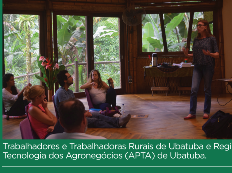
Trabalhadores e Trabalhadoras Rurais de Ubatuba e Região - STTR, Instituto Educa Brasil - IEB e Agência Paulista de Tecnologia dos Agronegócios (APTA) de Ubatuba.

O Instituto Supereco realiza o Projeto "Ecoagriculturas - práticas da agroecologia na proteção das águas" com a duração de 24 meses na UGRHI 03 - Litoral Norte, nos municípios de Ubatuba, Caraguatatuba, São Sebastião e Ilhabela, visando integrar as ações e experiências em agroecologia, com objetivos específicos de desenvolver estratégias de boas práticas de manejo das atividades agropecuárias para aproveitamento racional e proteção dos recursos hídricos.